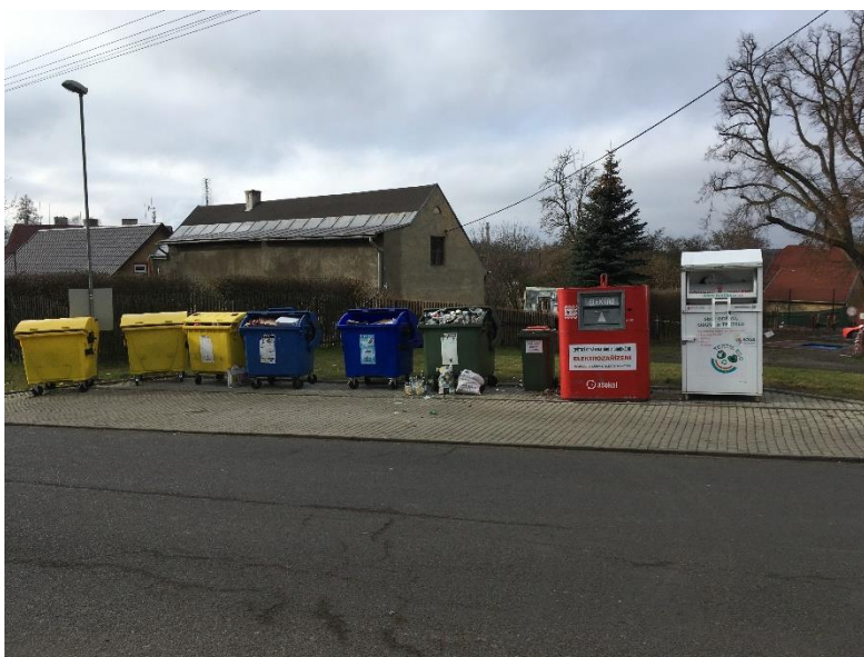
Obr. č. 2.: Jedno ze stanovišť pro sběr separovaného odpadu - lokalita Náměstí

V obci je rovněž možno využít služeb výkupního místa TSR Czech republic, s.r.o. Zde vykupují kovy, včetně železa, dále kabely a autobaterie. A nabízí také službu zpětného odběru elektrozařízení a elektroodpadu, která umožňuje řádnou separaci a recyklaci jednotlivých součástí a přispívá tak k ochraně životního prostředí.