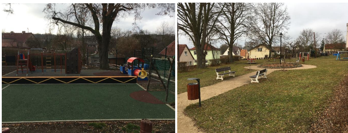
Obr. č. 6.: Dětské hřiště a parčík v ulici Kollárova