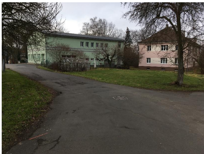
Obr. č. 3.: Kollárova ulice – prostranství pro vybudování parkoviště

míst. Otázkou je, zda bude obyvateli využíváno v dostatečné míře. Z praxe je zřejmé, že místní obyvatelé upřednostňují parkování co nejbliže bydlení.