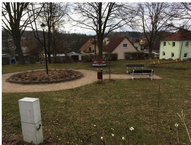
Obr. č. 7.: Parčík pro odpočinek u dětského hřiště ulice Kollárova

od 500 m 2 do 640 m 2 , celková plocha greenů včetně forgreenů je 13 793 m 2 . Každá jamka má 4 odpaliště 25 .