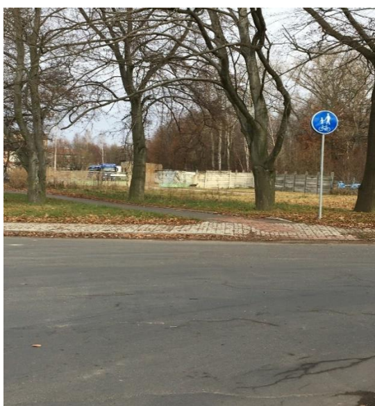
Obr. č. 4.: Stezka pro pěší a cyklisty vedoucí od Sokolova a budoucí stezka navazující

Již v letošním roce započne realizace výstavby dlouho očekávané cyklostezky, která byla navržena v rámci projektu „Cyklostezky po zaniklých obcích Slavkovského lesa a napojení na systémy v sokolovské kotlině“. Tato bude na etapy probíhat v horizontu několika následujících let. Společná stezka pro pěší a cyklisty bude lemovat pravou stranu komunikace III/21022 ve směru na Sokolov a bude plynule navazovat na stezku podél řeky Ohře vedenou od města Sokolov. Akce bude spolufinancována z dotačních prostředků.